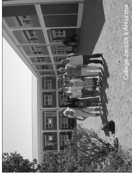
Collège Jacinta à Antsirabe