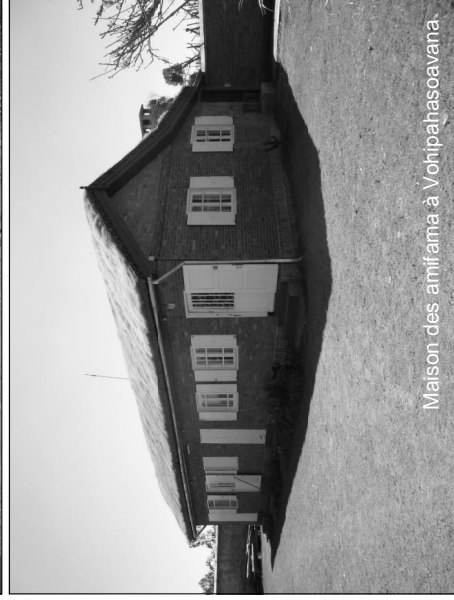
Maison des amifama à Vohipahasavana.