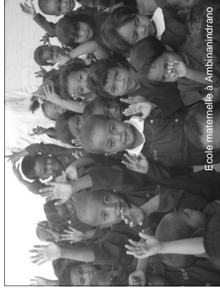
Ecole maternelle à Ambinanindrano