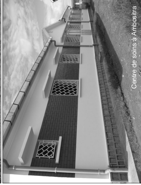
Centre de soins à Ambositra