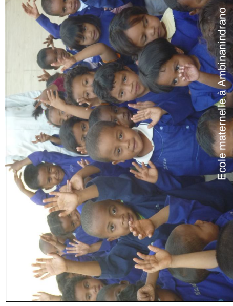
Ecole maternelle à Ambinanindrano