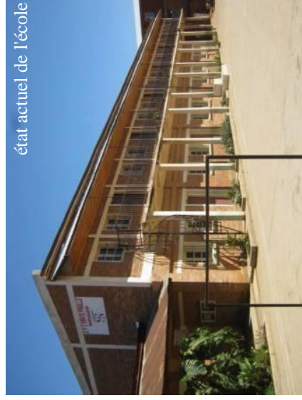
état actuel de l'école

Projet de rehaussement de l'Ecole de la Sainte Famille à Antsirabe Budget: environ 15 000 euros