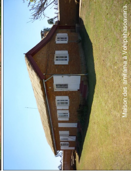
Maison des amifama à Vohipahasoaavana.