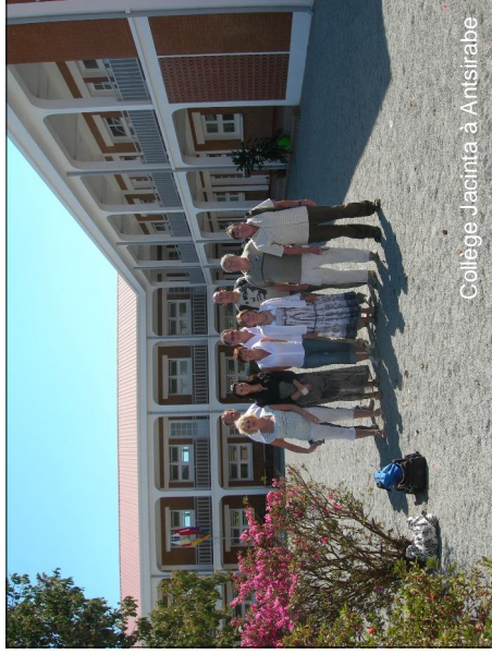
Collège Jacinta à Antsirabe