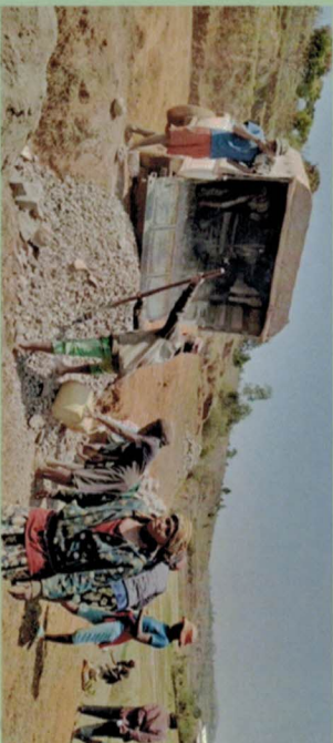
Participation à la réfection d'un barrage à Tsaravato.