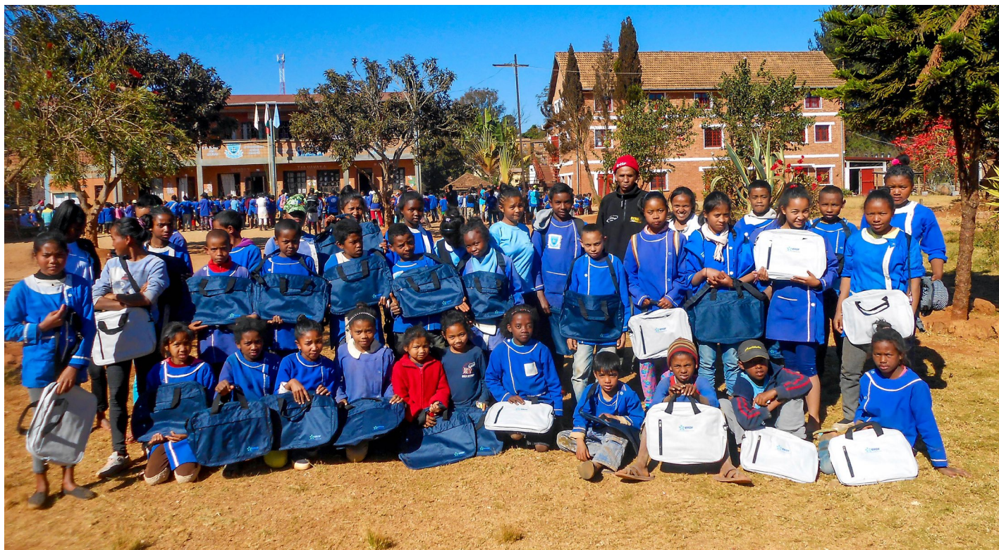
Les artistes, club de l'année 2017-2018

Le club Artiste a gagné le grand prix des Clubs de l'année 2017-2018 offert par Esperanza Joie des Enfants. Ce grand exploit a encouragé et motivé les membres à être toujours plus attentifs et engagé pendant les réunions du club et dans les différentes activités artistiques du Collège Picot. Mais si les artistes de Picot ont su développer la pédagogie des talents à travers les instruments de musique et montrer leurs